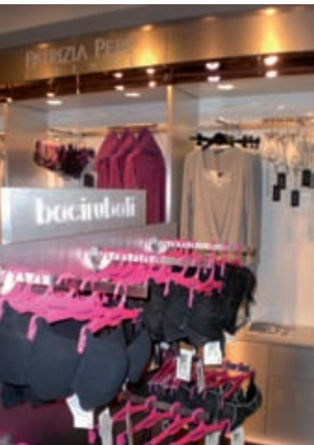
Il corner Bacirubati e Patrizia Pepe da Coin.

Nuove boutique e corner in Italia e in Europa