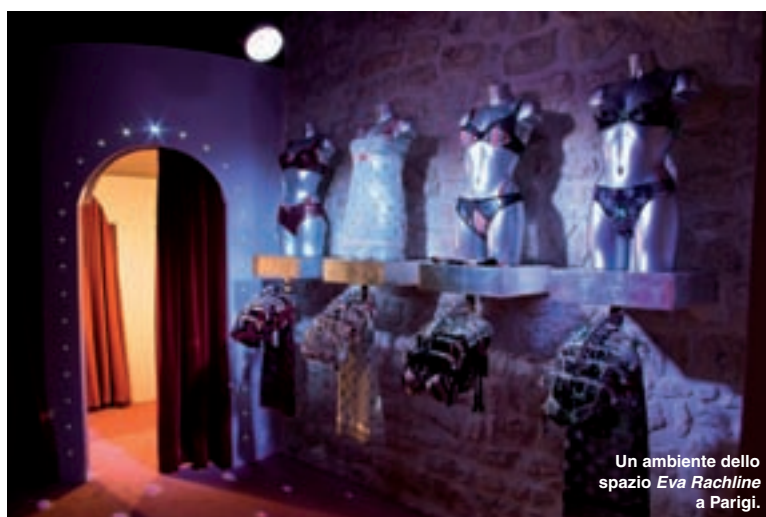
Un ambiente dello spazio Eva Rachline a Parigi.

Eva Rachline - 33 rue de Grenelle - Parigi