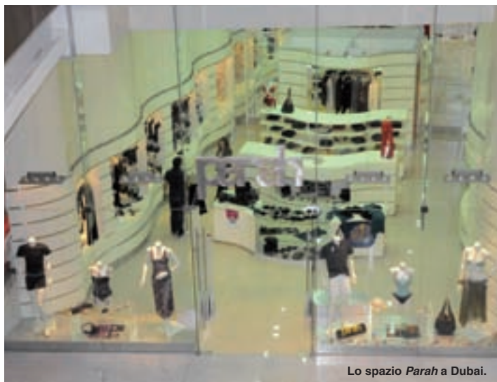
Lo spazio Parah a Dubai.

La città più affascinante della Sicilia è stata protagonista lo scorso 22 Novembre dell'inaugurazione del nuovo negozio licenziatario Parah. 40 metri quadrati, la boutique si affaccia con una grande vetrina in via Messina, nel cuore dello shopping cittadino. L'arredamento, in linea con quello degli altri negozi, è nei toni dell'écru e del beige, mentre banco e scaffali sono in cristallo sabbaiato. Due i salottini di prova, ampi e con comode poltrone. E, solo una settimana più tardi, è stata la volta dell'emirato più fashion: Parah è volata nella penisola arabica per l'inaugurazione, lo scorso dicembre, della boutique licenziataria numero tre a Dubai, negli Emirati Arabi Uniti, all'interno de The Dubai Mall, il centro commerciale che raggruppa oltre 1200 punti vendita su tre piani. Il Gruppo di Gallarate consolida così la partnership con lo stesso affiliato già proprietario degli altri due punti vendita a Dubai. 120 metri quadrati, situata al primo piano -sezione "Galleria" de The Dubai Mall, il nuovo negozio vanta un arredamento rinnovato, con scaffati color crema e profili in acciaio satinato, pedane in acciaio nelle vetrine, ripiani in cristallo e una parete a specchio. Parah - 1 st floor, Galleria - The Dubai Mall - Dubai • via Mazzini 24 - Palermo