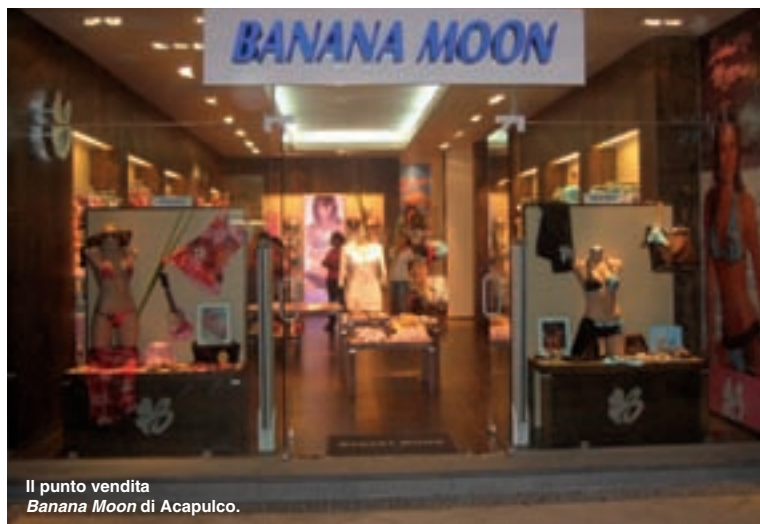
Il punto vendita Banana Moon di Acapulco.

I brand di culto nei luoghi più cool, in Italia, in Medio Oriente e in Messico