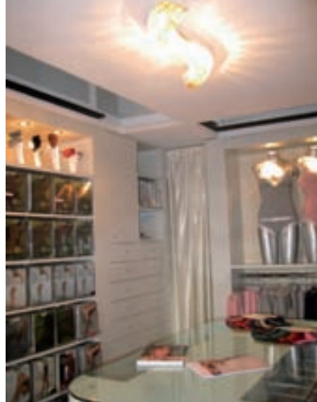
La nuova boutique Pierre Mantoux di Genova.

Esprit ha messo a punto un nuovo concept per i suoi Bodywear store, i punti vendita che identificano la linea di intimo e lingerie del colosso retail americano che l'anno scorso ha festeggiato i 40 anni di attività. Con una superficie compresa fra 80 e 130 metri quadrati, e una gamma di intimo che può soddisfare tutta la clientela target, i punti vendita Esprit Bodywear comprendono anche lingerie, loungewear e costumi da bagno, nonché accessori come pantofole e prodotti wellness. Un tipo di negozio che funziona bene sia come stand-alone che come shop-in-store . L'elemento che caratterizza il negozio è la parete di fondo, che permette di realizzare una presentazione armoniosa di tutte le categorie di prodotto, grazie al design contemporaneo, ispirato ai loft newyorchesi, e un nuovo sistema di illuminazione. Esprit propone al settore uno store concept che ottimizza la presentazione del marchio grazie a una sinergia fra rotazione del prodotto, tecniche visual, pubblicità e display. Dodici forniture annuali garantiscono stimoli continui per dare impulso all'acquisto. Info: Esprit - tel. 0281881701