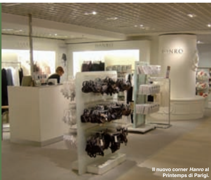
Il nuovo corner Hanro al Printemps di Parigi.

Hanro - Printemps - 64 Boulevard Haussmann - Parigi